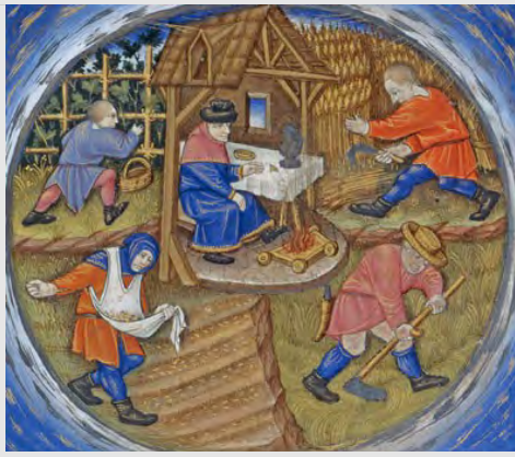
Les quatre saisons. Barthélemy l'Anglais Livre des propriétés des choses , Le Mans, milieu du XVe s. Paris, BnF, ms Français 135, f° 65