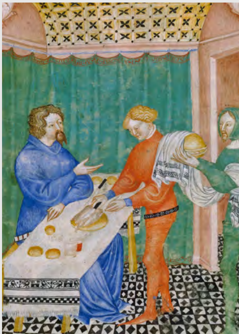
Nappe et serviette de service à l'iteaux Ibn Butlan, Tacuinum sanitatis , Pavieou Milan, v. 1400 Paris, BnF, ms Nal 1673, f°67

http://expositions.bnf.fr/gastro/index.htm