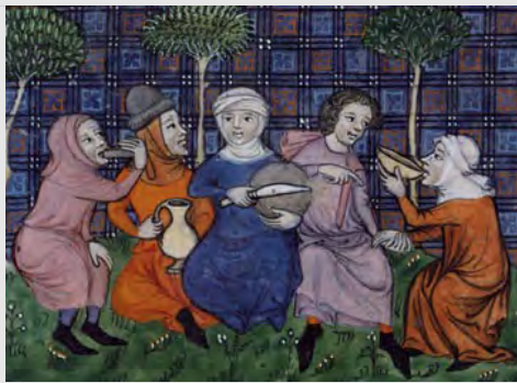
Le partage du pain : la miche paysanne. Guillaume de Machaut, Œuvres , Paris, fin du XIV e s. Paris, BnF, ms Français 22 545, f° 72